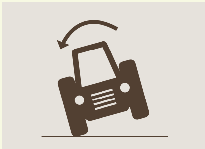
Umkippen im Gelände mit/ohne Anbaugeräte

Jeder Traktor muss mit einem Sicherheitsgurt ausgestattet sein und dieser muss auch benutzt werden.